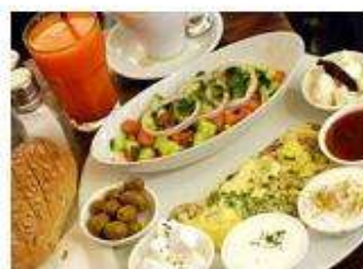
Special breakfast 38sh.

Krause Boardwalk, Netanya: 09-955-9945 052-770-6770